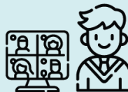
studentfakultetsråd (SFR) og fakultetstillitsvalgt (FTV)