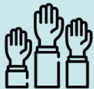
studenttinget på vestlandet (STVL)