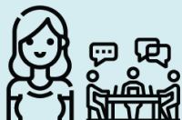
studentcampusråd (SCR) og campustillitsvalgt (CTV)